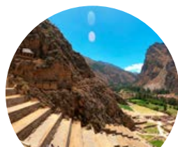
Vale sagrado dos Incas