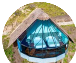
Mountain Sky View

Como nossos antepassados, temos profunda consideração pela Pachamama (Madre Tierra). Por isso, nossos acampamentos e lodges estão integrados com o ambiente, para não gerar impactos negativos.